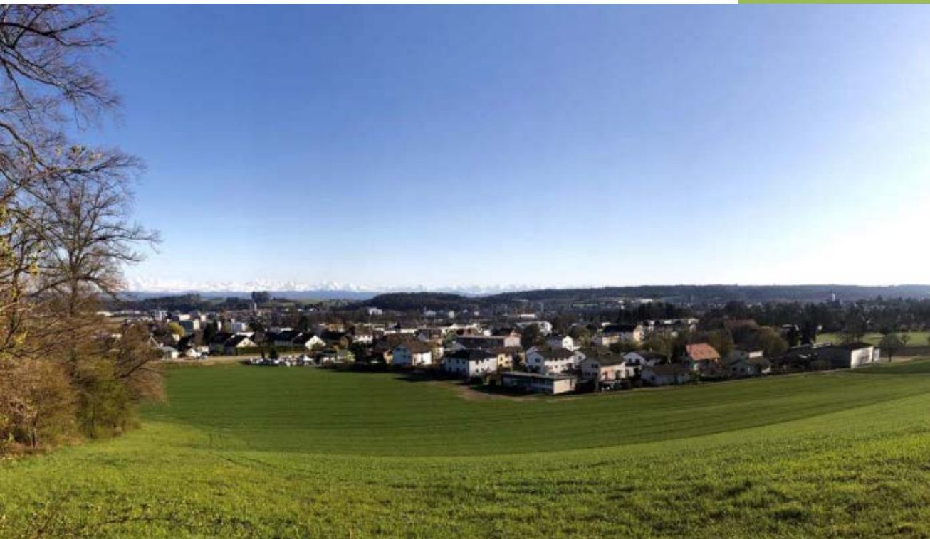
Feldbrunnen von Norden